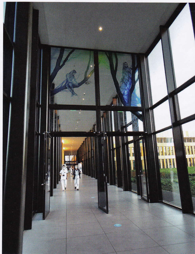
Gery Bouw en Jori van Boxtel, Panta Rhei , 2020; brandwerend vlakglas met kleurenprints; h. 390 cm, b. 410 cm. In gang nieuwe Amphia Ziekenhuis Breda

Stromingen zijn het uitgangspunt voor dit kunstwerk. De stromingen die door de mens heengaan zijn takken van bomen die gezien kunnen worden als bloedvaten. De mens en de natuur zijn versmolten met elkaar. De takken in het ontwerp groeien denkbeeldig uit de pilaren die daardoor stammen lijken. De stromingen verwijzen ook naar de stroom mensen die onder het kunstwerk doorloopt. De transparante vrouwfiguren op het glas stralen iets troostends, iets bemoedigends uit en