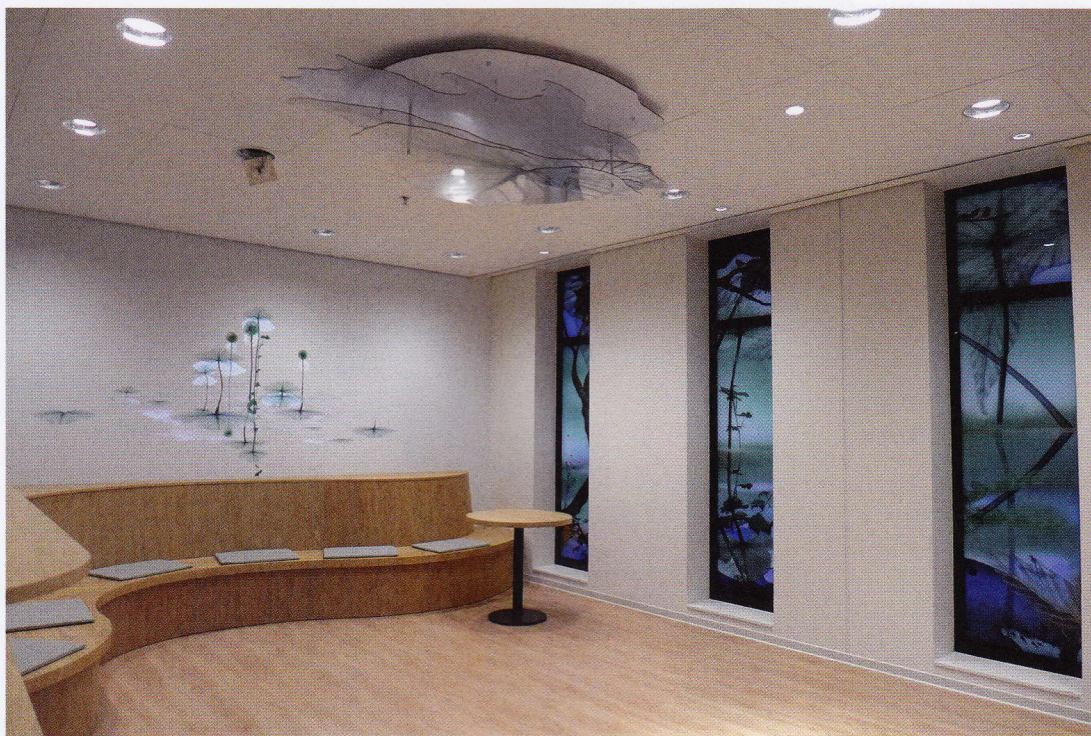
Gery Bouw, Bespiegeling , 2019; glaspanelen met digital geprinte en ingebrande emailles, plafondobject en animatie; diverse afmetingen. In Stiltecentrum Amphia Ziekenhuis Breda

In de ramen en deuren wordt het volgende verbeeld: